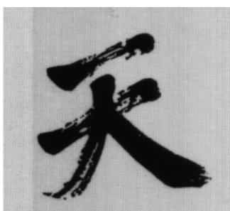
Figura 1. La conjugación de la conexión entre cielo, tierra y hombre da como resultado la armonía social.

El carácter Tian significa “Cielo – Naturaleza”, hace referencia a la naturalidad en una escala divina. El papel del Tian se basa en su herramienta que legitima a los soberanos.