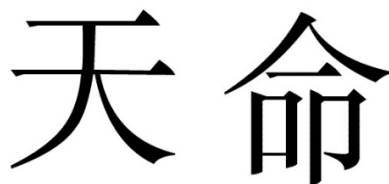
Figura 2. El mandato del cielo

El mandato del cielo se refiere a una concepción natural del Tian cuyo papel es el origen de la legitimidad del político. En China imperial el “mandato del cielo” actuó como modelo de gobierno. Pero en el caso Oriental a pesar de una estructura de poder imperial forjada de la mano del emperador, la legitimidad funciona de otra manera. Ya que no existe un poder absoluto del emperador a pesar de la relación jerárquica y vertical que ejerce (León de la Rosa, 2015).