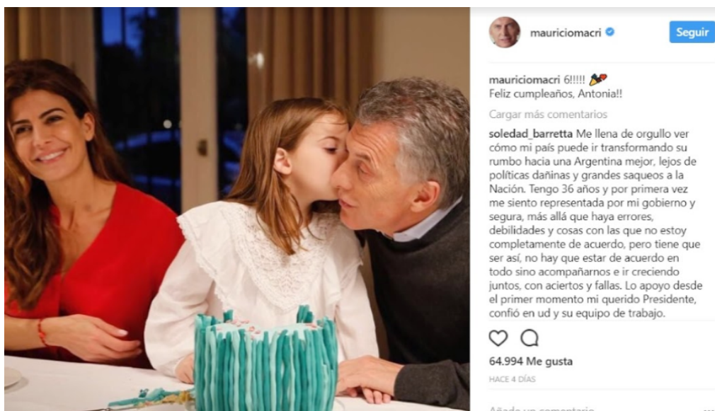
Imagen 3: Publicación de Mauricio Macri en Instagram 11/10/2017

Una última forma de figuración del ciudadano discutida anteriormente en Annunziata, Ariza y March (2018) fue el contenido de corte íntimo, donde el ciudadano aparece como el observador de la situación. El ciudadano se halla presente implícitamente, por fuera del texto y de la imagen y se lo deja mirar. Este tipo de contenidos contribuye a crear un cierto vínculo con el ciudadano en el cual el líder comparte sus momentos familiares, íntimos, cotidianos. El líder lo hace parte al ciudadano de su intimidad, de sus afectos.