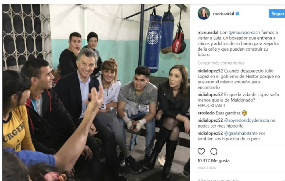
Imagen 1: Publicación de María Eugenia Vidal en Instagram 25/08/2017

Frecuentemente las historias de ciudadanos son publicadas en las redes luego de visitas a