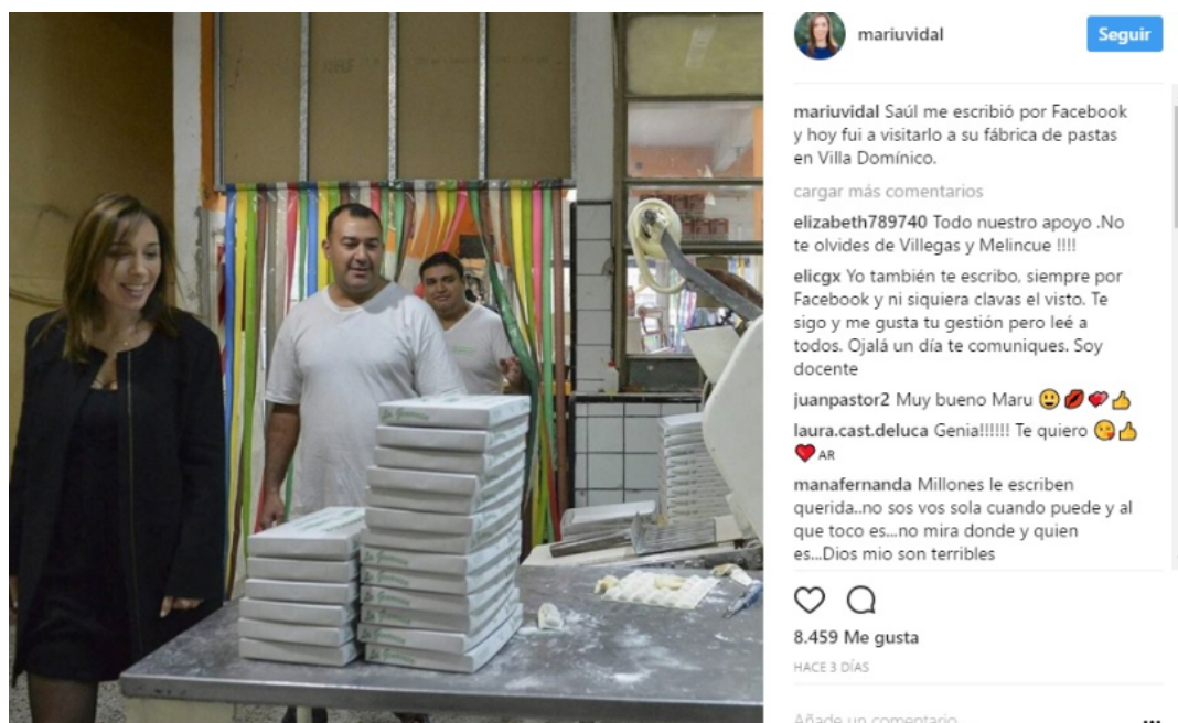
Imagen 2: Publicación de María Eugenia Vidal en Instagram 12/05/2017

Los llamados son la tercera forma en la que aparece el ciudadano en los contenidos compartidos por ambos dirigentes. El hecho de que el presidente o la gobernadora llamen a la casa de algún ciudadano contribuye a crear la imagen de un contacto directo y apela a la