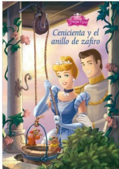
Imagen 6: “Cenicienta y el anillo de zafiro”. Editorial Libros Disney

Los cuentos de princesas de Disney -con contadas excepciones- se caracterizan por presentar este tipo de corporalidades que podemos observar en la imagen: las princesas son delgadas, siempre están vestidas muy elegantes con vestidos, guantes, joyas y zapatos de taco alto. Los príncipes, por otra parte, son esbeltos, musculosos, altos y también muy elegantes. Este cuento en particular relata la historia del anillo de zafiro que, el príncipe regala a la princesa por su aniversario, y esta última pierde en algún lugar de su hogar. Sus amigos, los ratones, finalmente lo encuentran, y ella puede usarlo para el baile que se celebrará en el castillo. Según la docente, los cuentos de princesas suelen ser los elegidos por las niñas, pero los niños también disfrutaban de escucharlos.