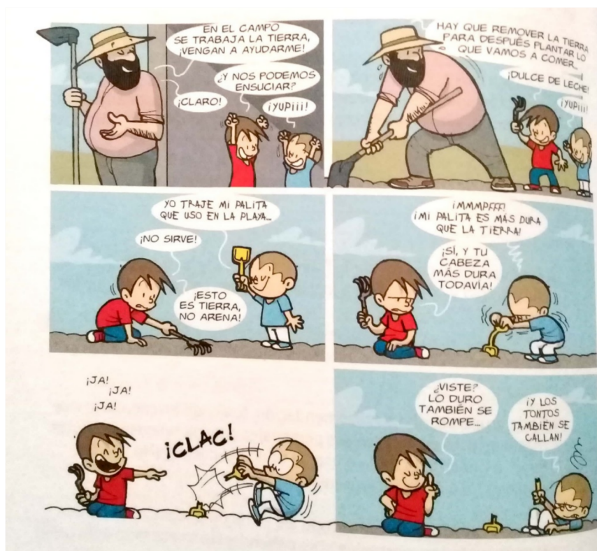
Imagen 3: “¡Ahora sabemos! 1”, Editorial Edelvives

A diferencia de “la familia”, el trabajo -profesiones, oficios, mundo laboral, etc.- no constituye un contenido a enseñar que se encuentre englobado en el diseño curricular. Sin embargo, las imágenes del manual muestran una clara tendencia a la división de roles y tareas de acuerdo a patrones de género previamente institucionalizados y establecidos: