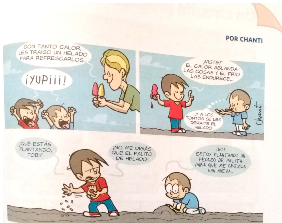
Imagen 4: “¡Ahora sabemos!1”, Editorial Edelvives.