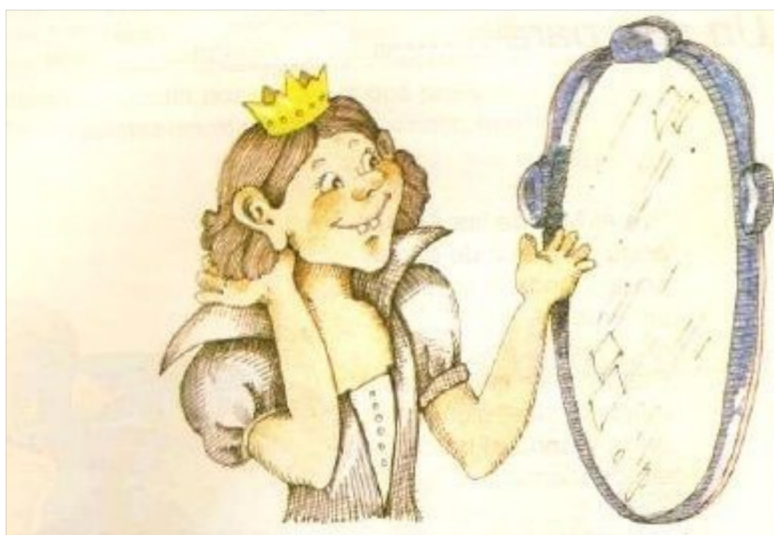
Imagen 7: “Flori, Ataúlfo y el dragón”, Editorial Aique.

A partir de la lectura del cuento, y las risas de los alumnos, la docente les preguntó: “¿Todos los príncipes son rubios, altos, musculosos? ¿Todas las princesas son bellas, usan vestido, y son delgadas? ¿Ustedes, son todos iguales? ¿Cómo son ustedes?” (Juana, 37). A raíz de esos interrogantes los/as alumnos/as comenzaron a charlar entre sí, utilizando palabras como “gordito”, “bajita”, “negro”, no en tono de burla, sino, simplemente, para describirse. De esta manera, observamos cómo la docente pone en cuestión los estereotipos corporales -que caracterizan al manual en su totalidad-, no solo a través de la lectura de un cuento “disruptivo” sino fundamentalmente interpelando a los alumnos/as para que, ellos mismos, reconozcan la gran diversidad que los caracteriza.