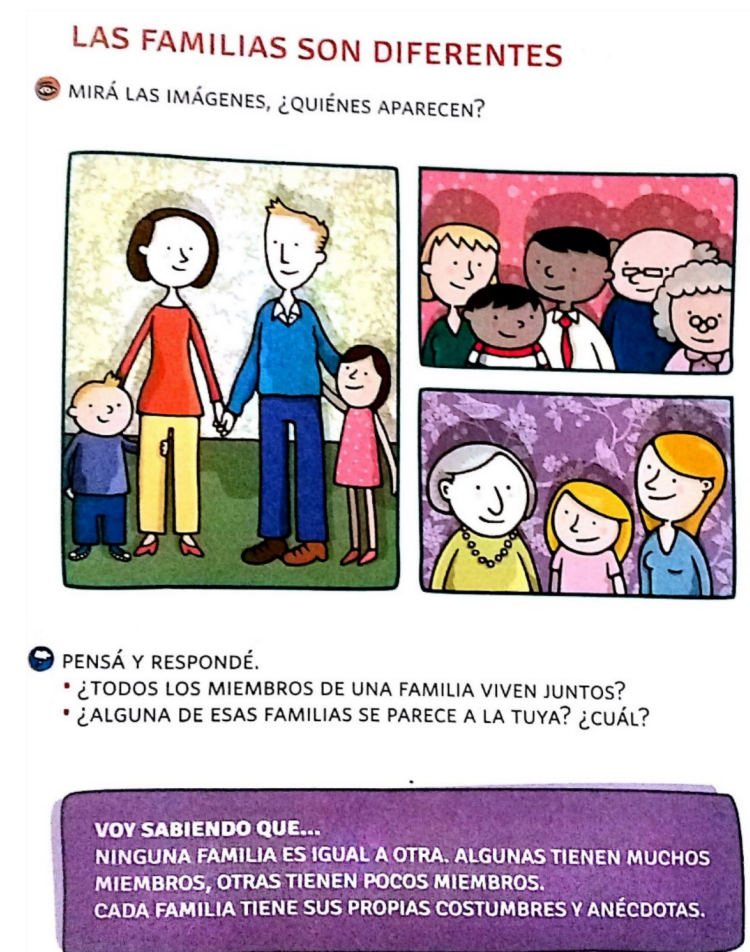
Imagen 2: “¡Ahora sabemos!”, Editorial Edelvives.

Este capítulo comienza con la siguiente actividad: