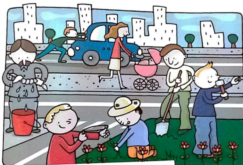
Imagen 5: “¡Ahora sabemos! 1”, Editorial Edelvives.

La historieta que puede observarse en las imágenes 3 y 4 muestran al abuelo -el que en el primer apartado exhibía una postura de autoridad- realizando tareas de fuerza en el campo, mientras que la abuela solo aparece para darle helado a sus nietos. Por otra parte, la Imagen 5 funciona como ilustración de una consigna en la que los/as alumnos/as deben registrar las tareas mecánicas que llevan a cabo las personas -